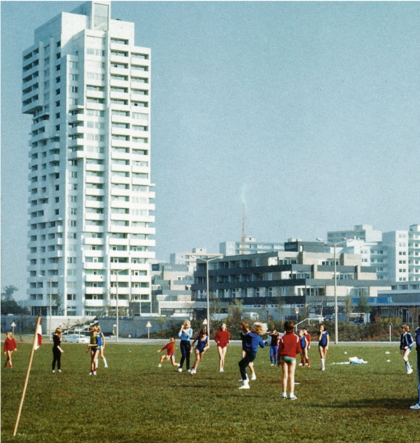
Der »Weiße Riese« in Kiel.