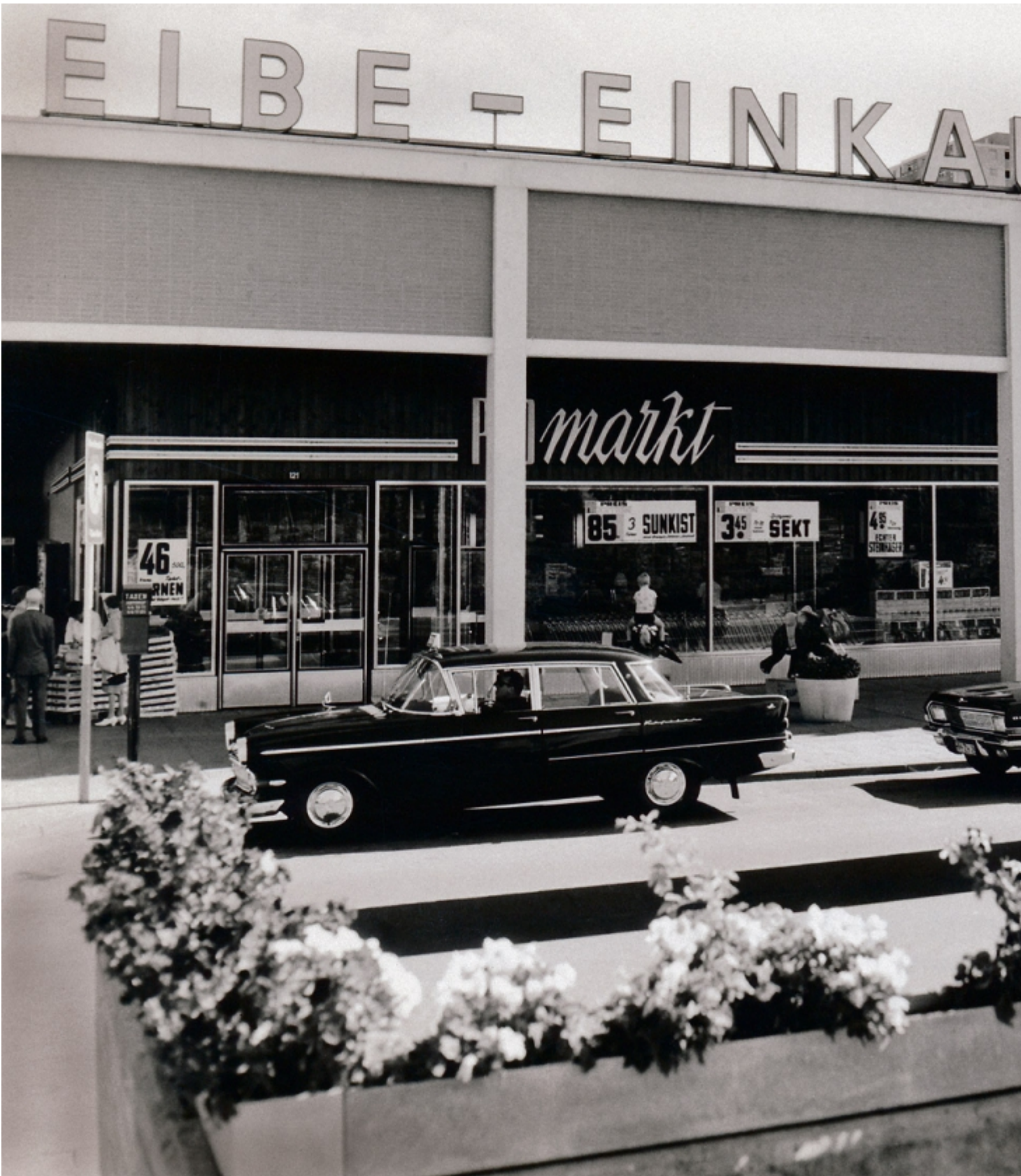
Elbe-Einkaufszentrum in Hamburg-Altona, 1966