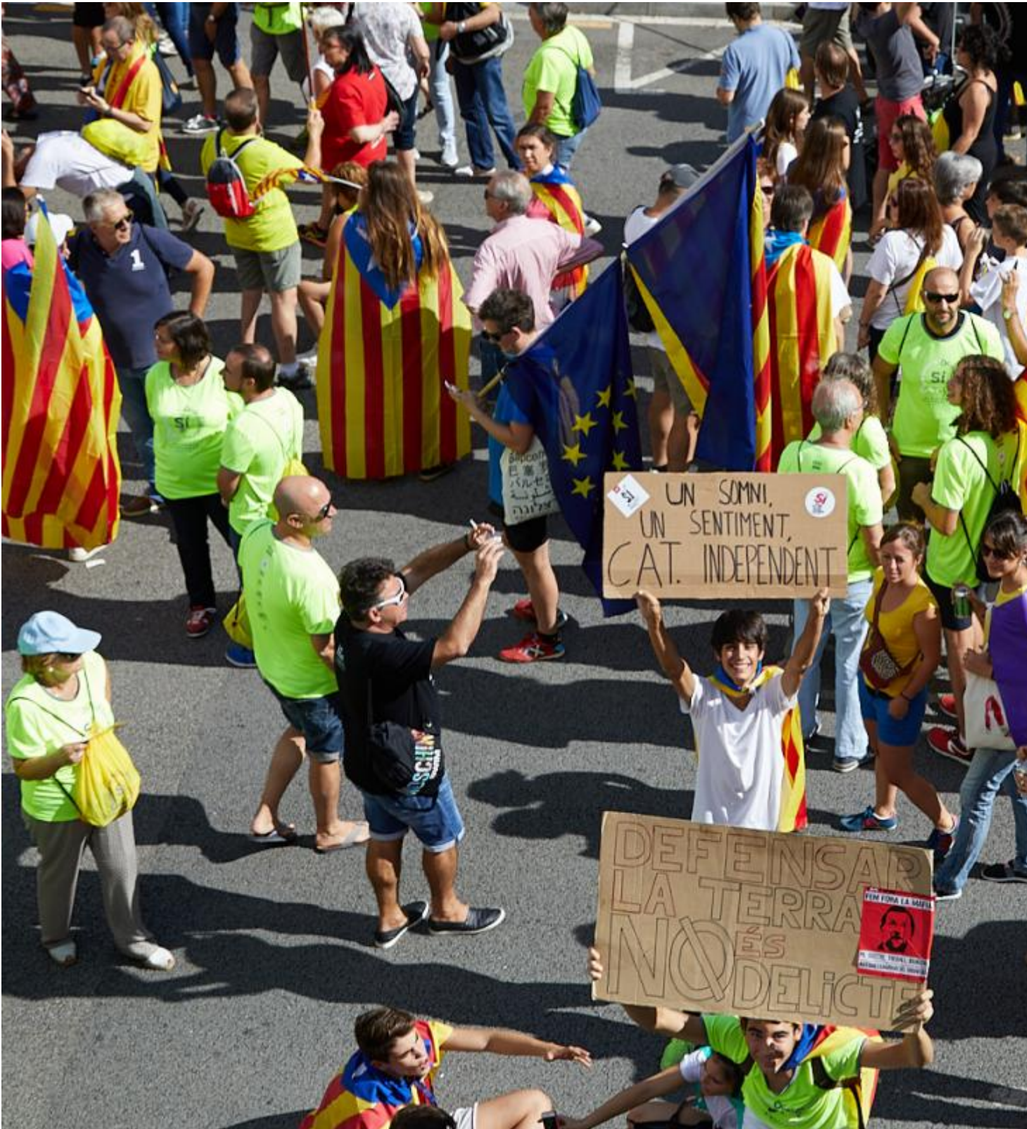
Demonstration in Barcelona, 11. September